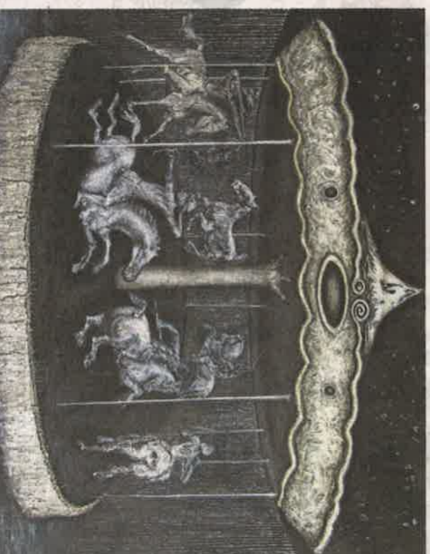
Beeld uit de serie 4.5 Square Feet of Freedom